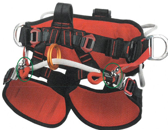
Ref.2163, Tree Access Evo

A ponte de corda no harnês modelo Tree Access Evo (ref.2163) é apertada através de anéis de metal com fecho de parafusos. Os parafusos permitem ao utilizador substituir a ponte de corda em caso de desgaste. Ver imagem abaixo.